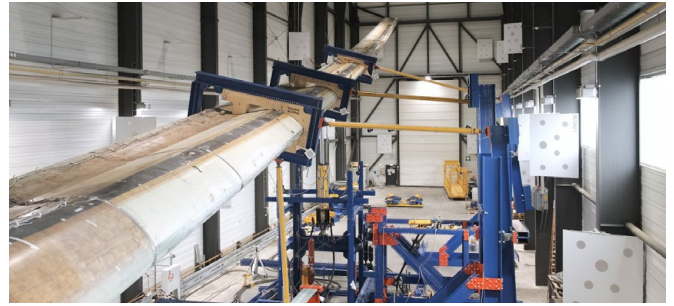
Biaxialer Ermüdungsprüfstand mit Federelement und entkoppelten Massen

Zunächst wird die Ermüdungsprüfung für eine bestimmte Anzahl von Zyklen an einem ganzen Blatt durchgeführt. Anschließend wird das Rotorblatt in zwei Segmente getrennt und zwei weitere Ermüdungstests an Wurzel und der Spitze des Blattes werden durchgeführt. Dies verkürzt die Prüfzeit erheblich und reduziert Überlastungen. Eine Fallstudie für ein 110 m langes Referenz-Offshore-Blatt hat gezeigt, dass die Prüfzeit um 65 % reduziert und die Schadensakkumulation über den Zielwerten um 75 % verringert werden kann.